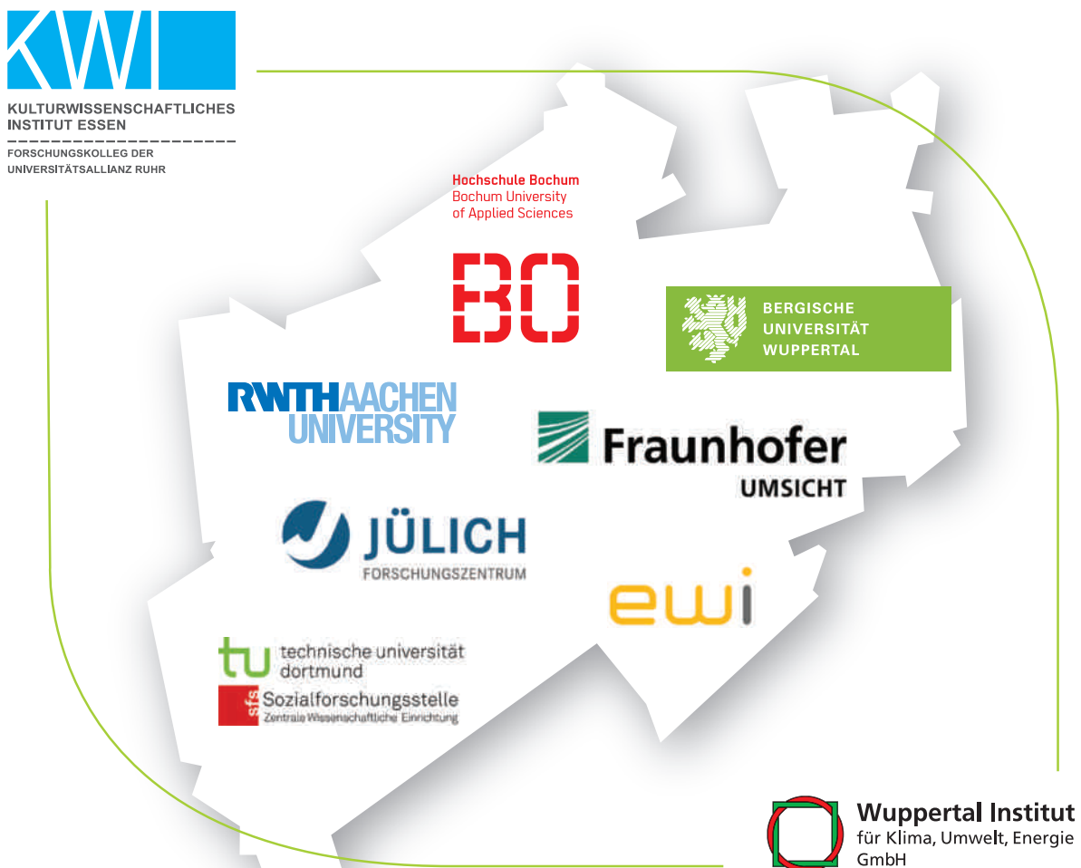
Abbildung 2 / Das Konsortium des Virtuellen Instituts

und Wissenschaftlern verschiedener Disziplinen und eine zunehmende Kopplung wissenschaftlicher Prozesse mit der politischen und gesellschaftlichen Entscheidungsfindung erforderlich macht. Das Virtuelle Institut befasst sich vor diesem Hintergrund prioritär mit den bestehenden Forschungslücken im Bereich der sozio-ökonomischen und sozio-kulturellen Dimension der Energiewende. Es adressiert damit vor allem die nicht-technischen Aspekte der Energiewende. Technische Studien werden im Rahmen des Virtuellen Instituts nicht durchgeführt, jedoch als wichtige Wissensgrundlage für die Ableitung und Analyse sozio-ökonomischer und -kultureller Fragestellungen herangezogen.