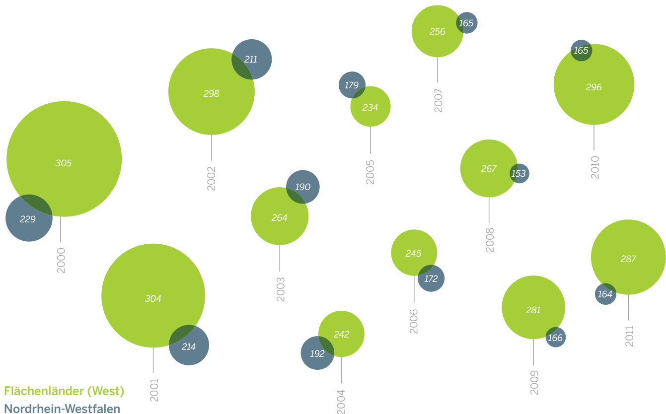
Abbildung 2 / Durchschnittliche Sachinvestitionen (in Euro) der Kommunen in Nordrhein-Westfalen pro Einwohner im Vergleich mit den westlichen Flächenländern, 2000–2011.

Davon arbeiten etwa 20.700 Bergleute in Nordrhein-Westfalen (MKULNV NRW 2012b). Dieser massive Strukturwandel hat deutliche Spuren hinterlassen und wirkt sich erkennbar auf die ökonomischen Kennzahlen des gesamten Bundeslandes aus. So hat die schwierige wirtschaftliche Situation im alten Steinkohlerevier erheblich dazu beigetragen, dass Nordrhein-Westfalen mit etwa 4,8 Milliarden Euro in 2010 und geschätzten 6,5 Milliarden Euro in 2013 (Statista 2014) das am höchsten verschuldete Bundesland in Deutschland ist. Die kritische Haushaltslage schränkt die politische Gestaltungsfähigkeit ein, und zwar nicht nur auf der Landesebene selbst, sondern auch und gerade auf kommunaler Ebene. Im Jahr 2011 konnten Nordrhein-Westfalens Kommunen im Schnitt 164 Euro an Sachinvestitionen je Einwohner tätigen. Die durchschnittlichen kommunalen Investitionen in den westdeutschen Flächenländern (also alle westdeutschen Bundesländer ausgenommen der Stadtstaaten) lagen hingegen bei 287 Euro pro Einwohner (Städtetag NRW 2012).