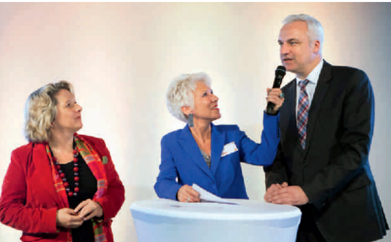
Interview mit NRW-Wirtschaftsminister Garrelt Duin und NRW-Wissenschaftsministerin Svenja Schulze zum Thema »Gestaltung des Fortschritts in NRW«.